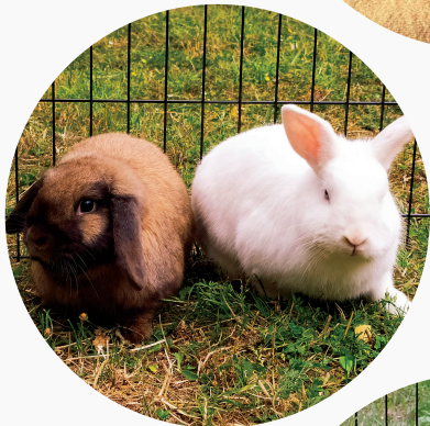
Samba & Loki