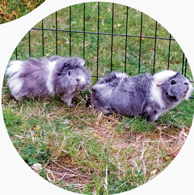
Paupiette & Kiwi